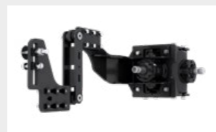
Sistema di regolazione del parallelismo tipo W