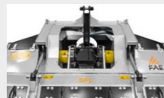
Sistema di regolazione del parallelismo tipo Z