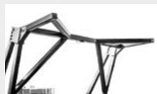
Abbattirami meccanico convoglia il materiale prima della triturazione