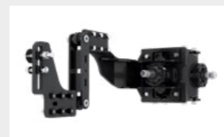
Système de réglage du parallélisme type W