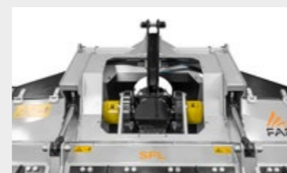
Système de réglage du parallélisme type Z