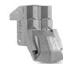
OUTIL C/3/SS (marteau lateral)