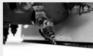
Outils pour les travaux sur le béton