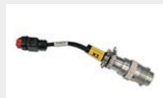
Câblage de connexion Câblage adaptateur permettant une connexion Plug & Play avec les chargeuses compactes les plus courantes