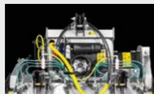
Système d'injection d'eau WSS Basic pour réduire la quantité de poussière et refroidir les outils