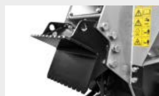
Bec excavateur frontal