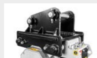
Plaque d'attache boulonnée (suivant les mesures)