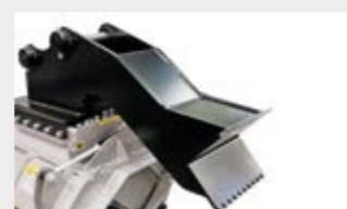
Plaque d'attache boulonnée et pied d'appui (suivant les mesures)