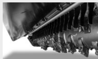
Grille du capot