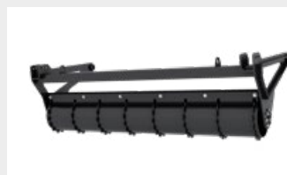
Rouleau de support à réglage hydraulique