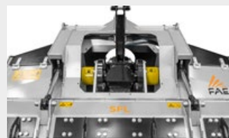
Système de réglage du parallélisme type Z