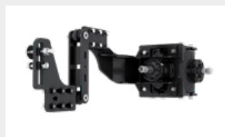
Système de réglage du parallélisme type W