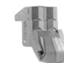
OUTIL C/3/SS (marteau lateral)