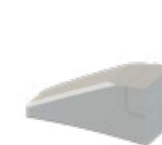
OUTIL BAZ (marteau lateral)