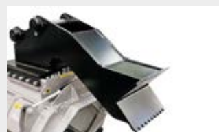
Plaque d'attache boulonnée et pied d'appui (suivant les mesures)