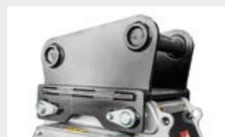
Plaque d'attache boulonnée (suivant les mesures)