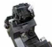
Plaques vissées pour chaînes de protection

Moteur VT à cylindrée variable pour augmenter la performance et réduire les coûts de service