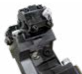
Cadenas/láminas de protección atornilladas

Motor de torque variable VT para aumentar el rendimiento y reducir costos de operación