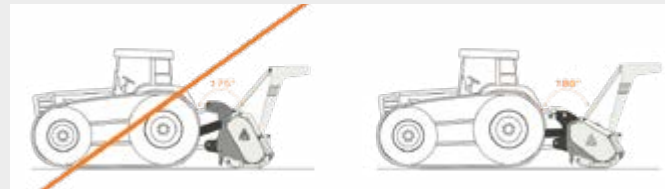
Modell für Traktoren mit niedrig liegender Zapfwelle (z.B. Raupentraktoren)