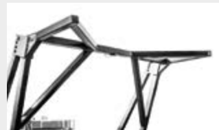
Mechanische Druckevorrichtung führt das Material vor dem Mulchen zusammen