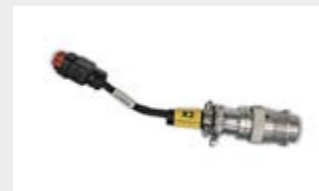
Anschlussverkabelung Adapterverkabelung, um eine Plug&Play-Verbindung mit den gängigsten Kompaktladern zu ermöglichen